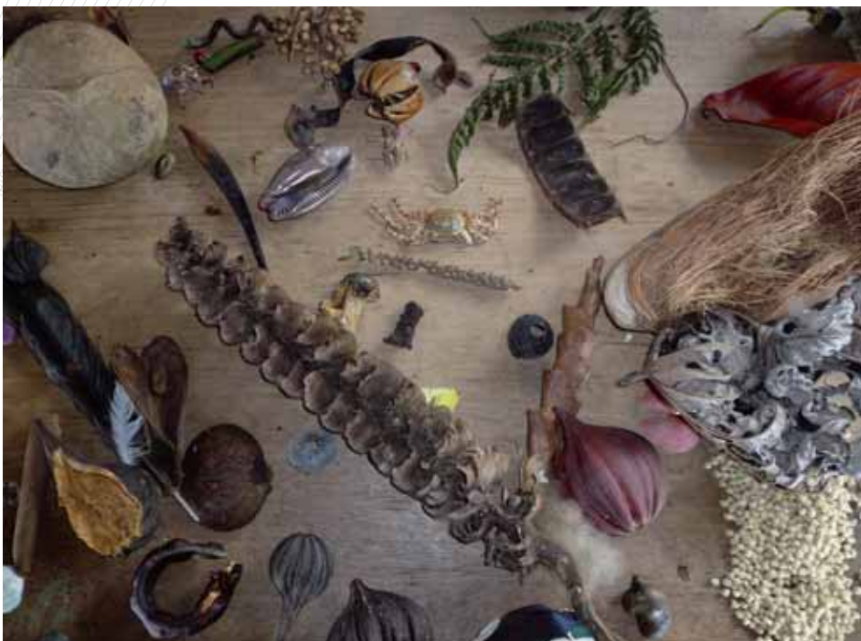
Proben aus dem Regenwald, Biomimicry Workshop 2008