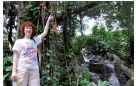
Lianen in Malaysia